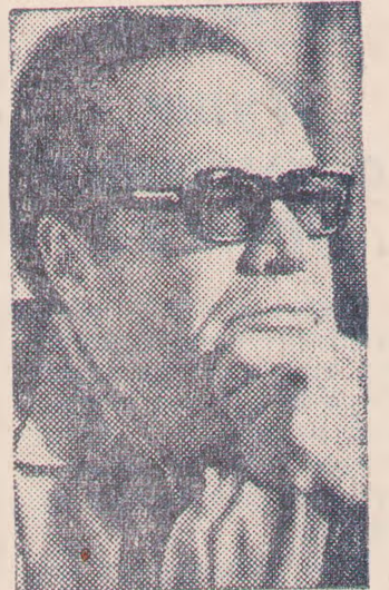
Поэт Михаил Матусовский автор многих популярных песен.

Михаил Львович Матусовский представлен на соискание Государственной премии СССР за песни последних лет: «Березовый сок», «Шхатерская», «Девушка из Бреста».