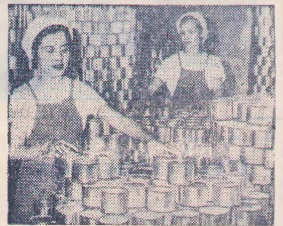
Фруктовые и овощные консервы, изготовленные в Социалистической Республике Вьетнам, завоевывают все большую популярность на международном рынке. НА СНИМКЕ: на намдиньской консервной фабрике.