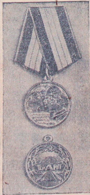
Медаль «За строительство Байкало-Амурской магистрали».